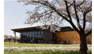
民間のアイデアで 魅力ある水辺空間を創出