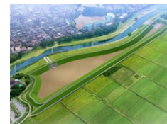
調節池の整備 (ハード対策)