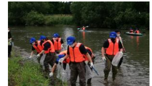
美化活動や 環境学習の場を提供