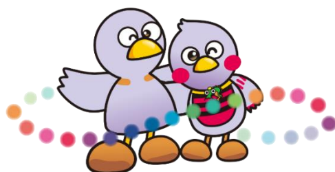
埼玉県のマスコット コバトン・さいたまっち

このリーフレットは65歳未満で認知症と診断された方が適切なサービスを受けられるよう、道しるべとして作成しました。