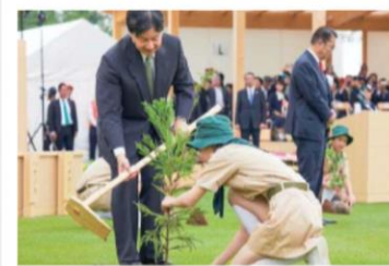
第70回 全国植樹祭(令和元年愛知県)