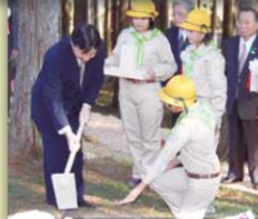
昭和天皇陛下がお手植えされたヒノキを 当時の皇太子殿下がお手入れ