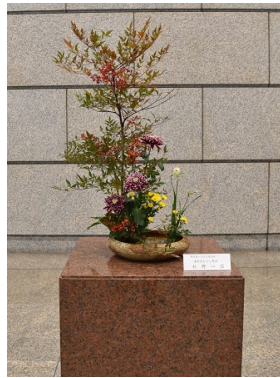
遠州流むさし 野派 杉野 一信様 ◆花材 南天、菊2 種、水仙、オ モト