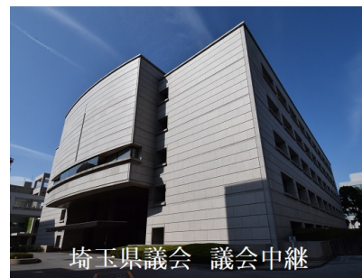
埼玉県議会 議会中継