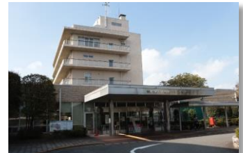
総合リハビリテーションセンター