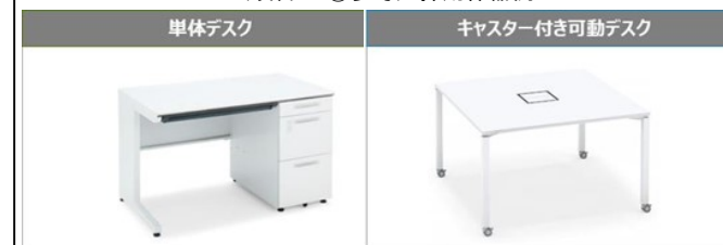
(項目2.①参考) 採用什器例