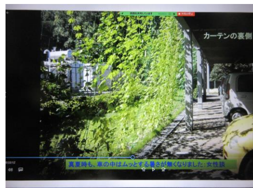
立体駐車場カーテン：裏側