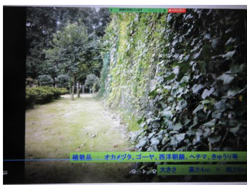
立体駐車場カーテン：表側