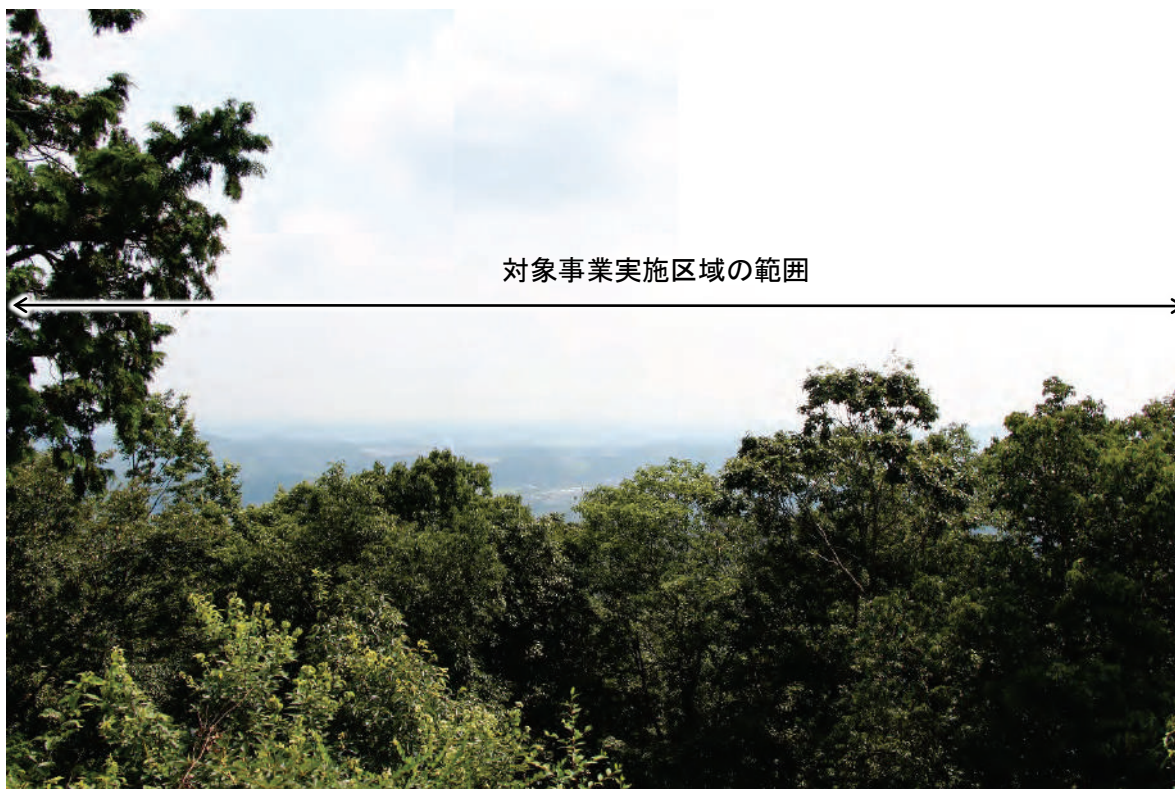
図 8-1-7-4(13) 石尊山 着葉期（現状）