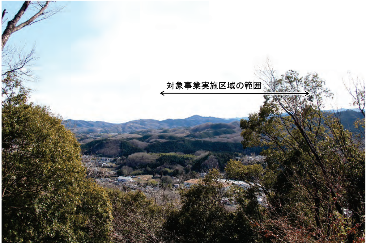
図 8-1-7-4(7) 県立小川げんきプラザ 落葉期（現状）