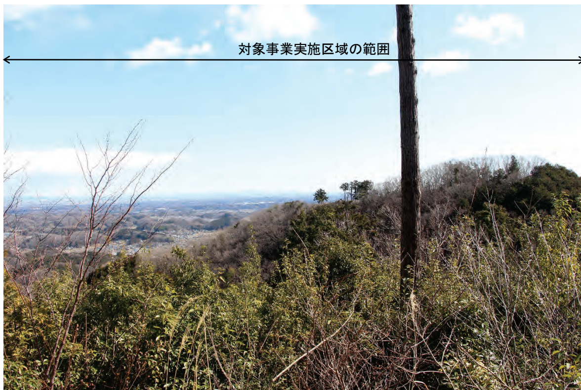
図 8-1-7-4(11) 官ノ倉山 落葉期 (現状)