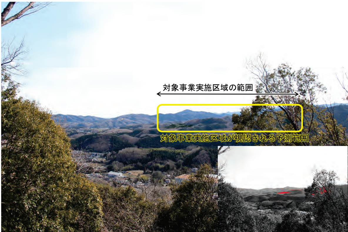
図 8-1-7-4(8) 県立小川げんきプラザ 落葉期（将来）