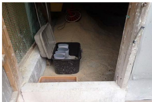
家きん舎専用の長靴の設置