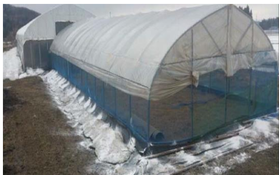
家きん舎周囲の消石灰の散布