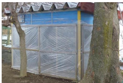
寒冷対策を兼ね、シートを張った 野生動物侵入防止対策