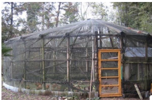
魚網やネット等を活用した 野生動物侵入防止対策