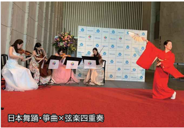
日本舞踊・箏曲×弦楽四重奏