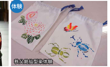
秩父銘仙型染体験