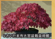
さいたま市大宮盆栽美術館

2021.11.20(土) 10:00 - 19:00 - 21(日) 10:00 - 16:00