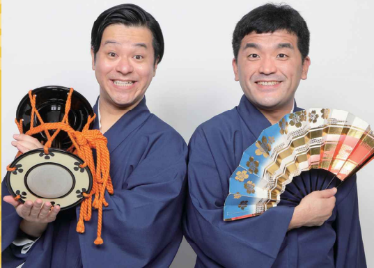
お笑い芸人 すゑひろがりず