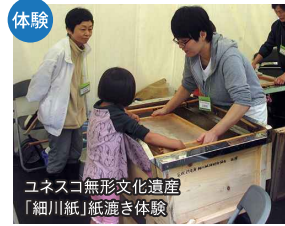
ユネスコ無形文化遺産「細川紙」紙漉き体験