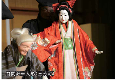
竹間沢車人形 (三芳町)