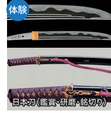
日本刀(鑑賞・研磨・銘切り)