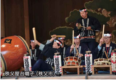
秩父屋台囃子 (秩父市)