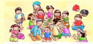
こども応援ネットワーク埼玉