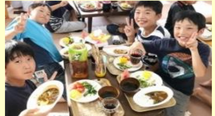
三芳おなかま子ども食堂 (H30)