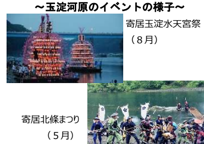
玉淀河原の賑わいを町全体に！！