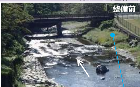
道の駅となりの河原をもっと使いたい

横瀬川を訪れる人が、隣接する道の駅果樹公園あしがくぼやその周辺の観光スポットを巡ることで、賑わいを町全体に広げ、町民も観光客も楽しめる「訪れたいくなる活気あるまちづくり」を目指しました！