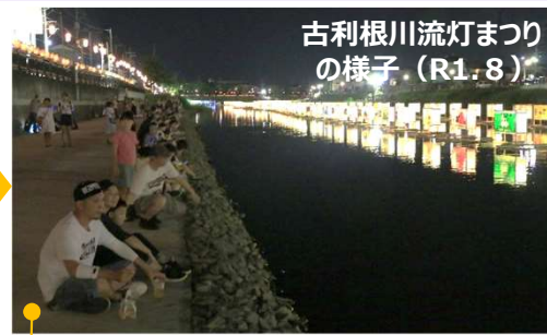
水際の遊歩道を使って間近に見られるようになりました！