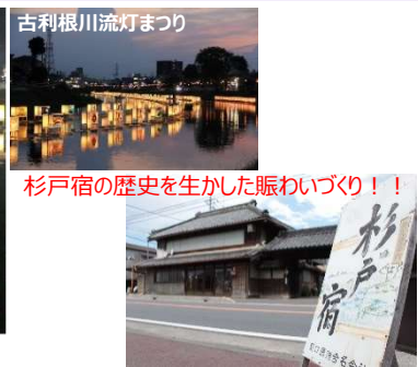
杉戸宿の歴史を生かした賑わいづくり！！