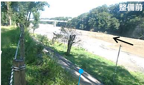
イベントが観覧しづらい

中心市街地、玉淀河原、雀宮公園及び鉢形城跡等をつなぎ、市街地、水辺及び史跡が一体となった良好な空間を創出し、町民と観光客とが交流を楽しみながら町全体に賑わいを創出していくことを目指します！