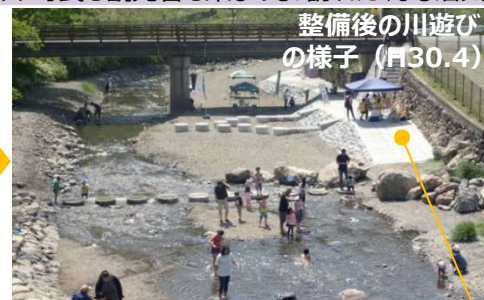
階段や通路を使って河原の遊び場ができました！