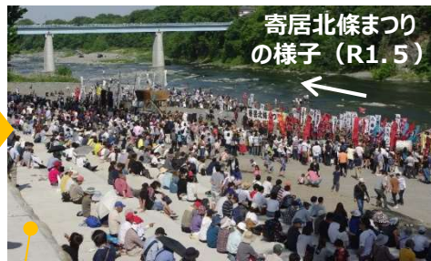
階段状の護岸を使って観覧しやすくなりました！