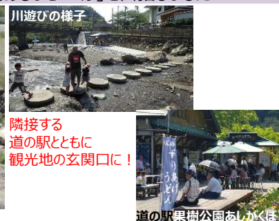
隣接する道の駅とともに観光地の玄関口に！