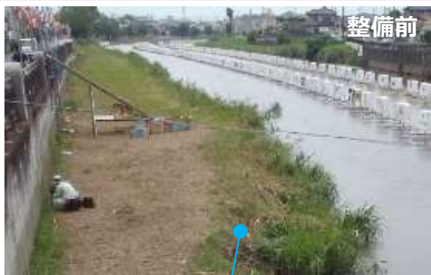
水辺に近付きにくい

水運の歴史を持つ大落古利根川を新たな水辺の観光ルートとして位置づけ、既存の杉戸宿の街道と連携させることでまち全体への回遊性を高め、更なるにぎわいの創出を目指します！