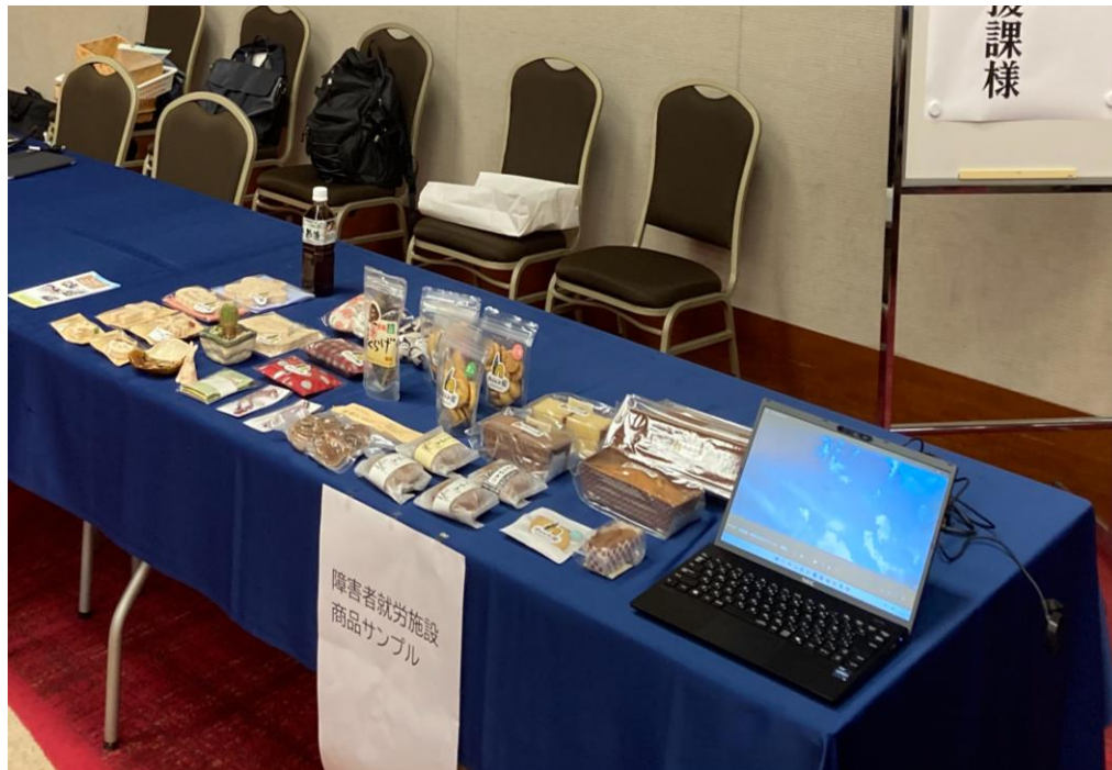
企業交流会へブース出展