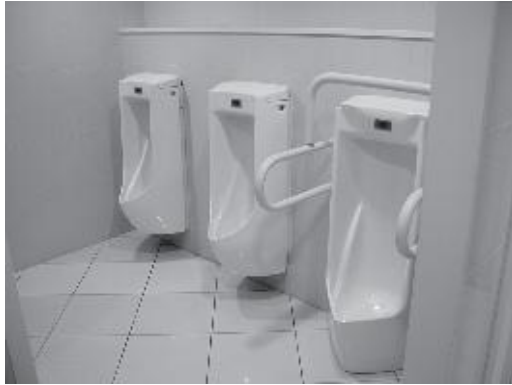
図. 手すり付床置式小便器