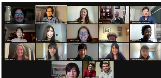
ゲストの方をお招きしたセッション

この2ヶ月の間に通常の授業の他に特別なゲストをお招きするセッションなどもありました。そちらについては最終レポートでもう少し詳しくお話ししたいと思います。またフィンドレー大学の学生さんがフィンドレー大学のキャンパスツアーを計画してくださり、