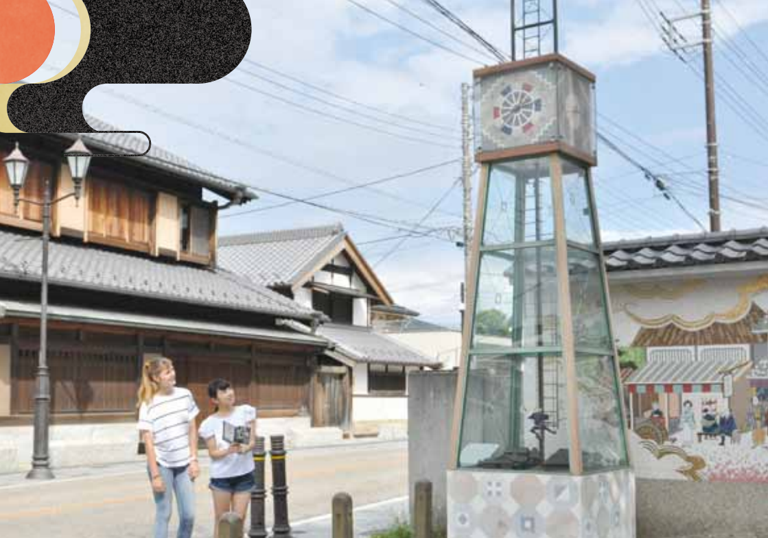
中仙道蕨宿 Nakasendo Road Warabi-juku