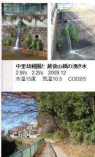
中里幼稚園と 越後山橋の湧き水 2.8ℓ/s 2.2ℓ/s 2009.12 水温15度 気温10.5 COD2/5