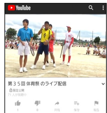
【体育祭のライブ配信】

「学力向上を目指したICTの効果的な活用」についても同様であると考え。ハード面における整備も重要であるが、それ以上に、どう活用するかが重要である。今後、ICTを活用した授業研究会の実施及び優れた実践の普及など、教職員のアイデアを大切に授業改善を推進する。