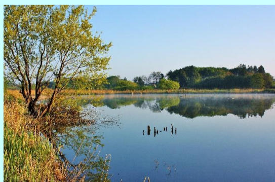
黒浜沼 春の朝 土屋 君代