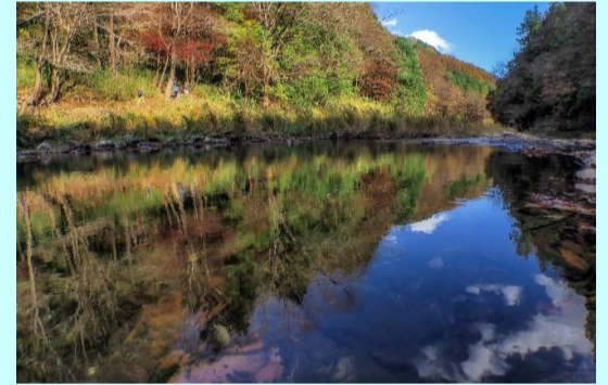
嵐山溪谷の水彩絶景 角張 洋司