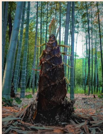
若竹天へ 堀越 力男