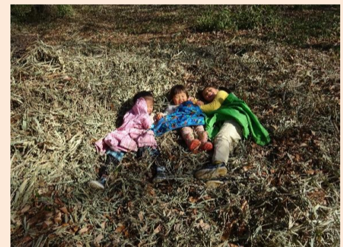
刈り取った枯れ草でベッドを作ったよ 塘 久夫