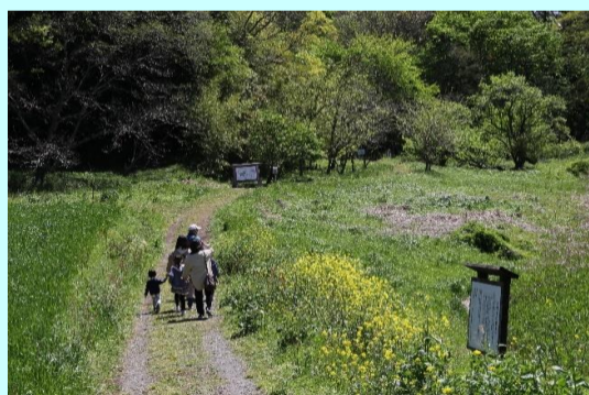
家族でぶらっと散歩！ 滝瀬 初男