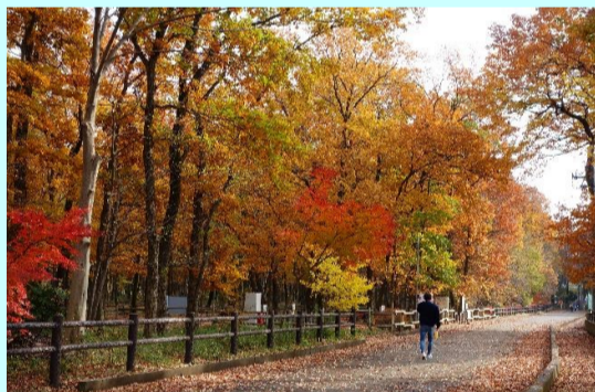
晩秋 後藤 實