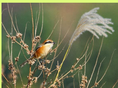
ススキ観賞 平山 泰広 @_yhb.world_