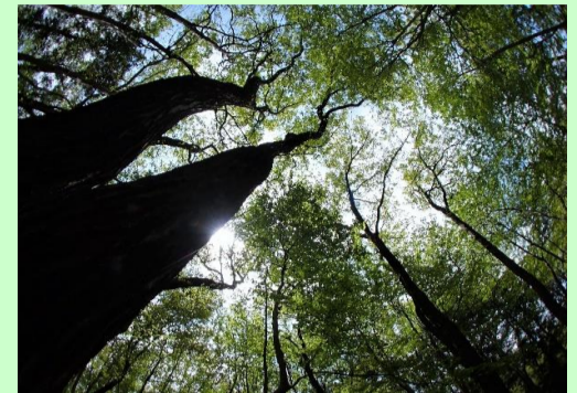
新緑の林 笠原 秀夫