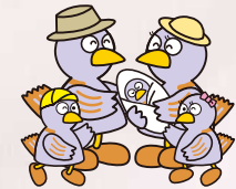
埼玉县吉祥物 小紫鸽