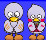
埼玉県マスコット 「コバトン」「さいたまっち」