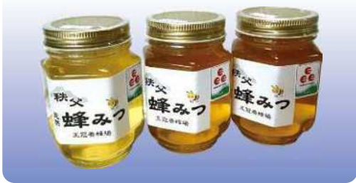
王冠蜂みつ 260g ¥2,100