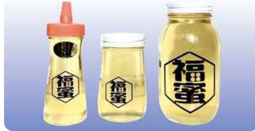
福蜜はちみつ 250g ¥1,300 500g ¥2,600 1,200g ¥6,100