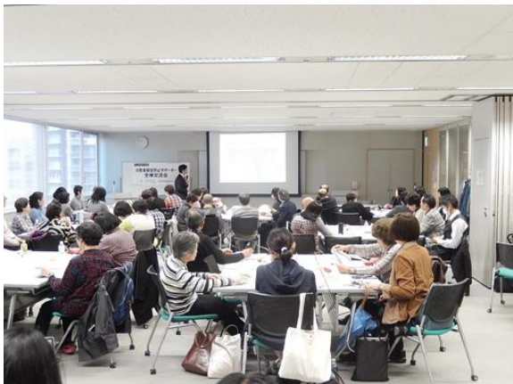
◎地区別フォローアップ研修・交流会