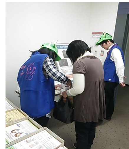
啓発グッズを配布する様子