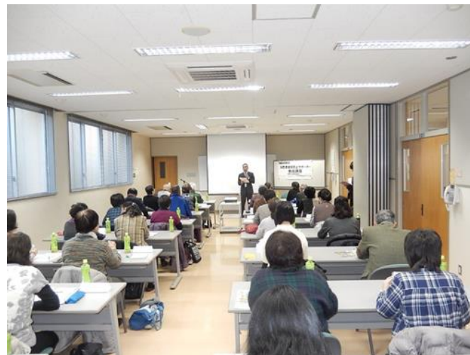
消費者被害防止サポーター養成講座の様子