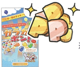
▲「ガラガラポン!」でボーナスポイント