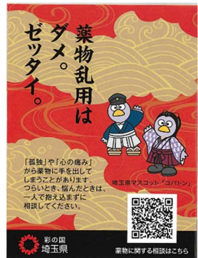
右図：裏面 (薬物乱用防止啓発)