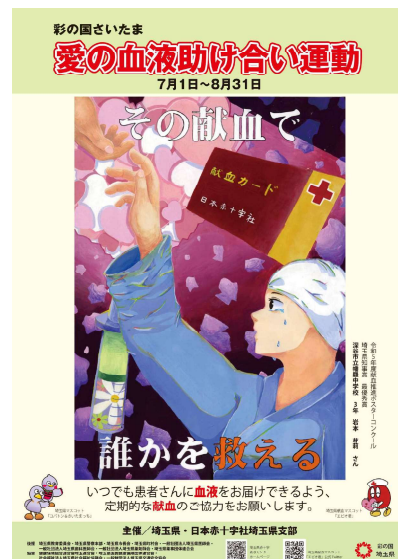
作成したポスター

また、24点の優秀作品は7月10日から8月4日まで県庁3階渡り廊下で、埼玉県赤十字血液センター所長賞を含む60点の作品を8月8日に埼玉会館で展示しました。