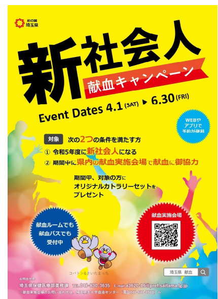
右図：広報ポスター