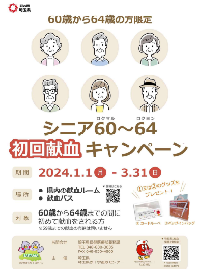
右図：広報ポスター