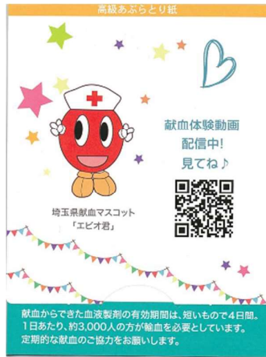
左図：表面 (献血啓発)