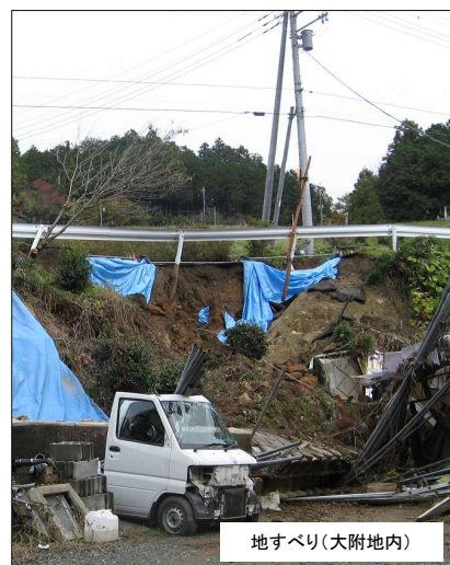
地すべり(大附地内)