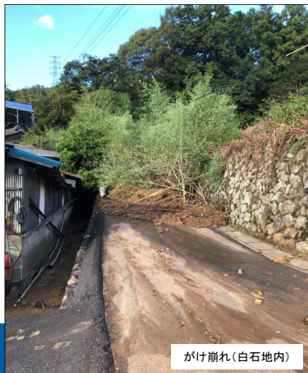
がけ崩れ(白石地内)