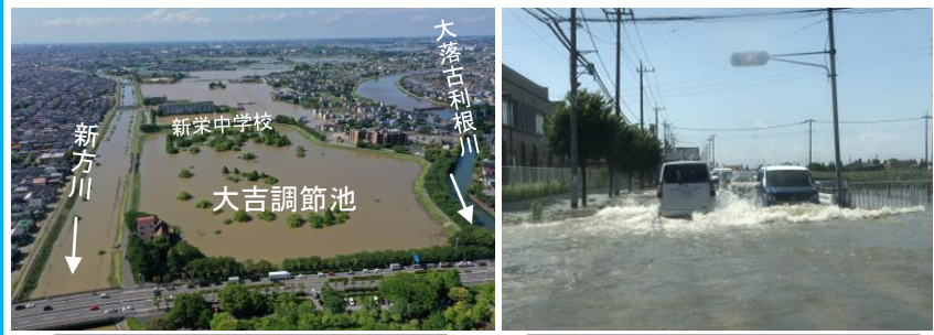
大吉調節池(新方川)周辺 令和5年6月3日午後