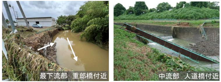
ときがわ町被害状況写真