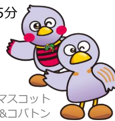
埼玉県マスコット さいたまっち&コバトン

J R 高崎線本庄駅南口より、徒歩約15分または車約5分 J R 上越新幹線本庄早稲田駅より、徒歩約20分 ※上記駅より「はにぼんシャトル」をご利用の場合、 “⑤新田原”停留所にて下車