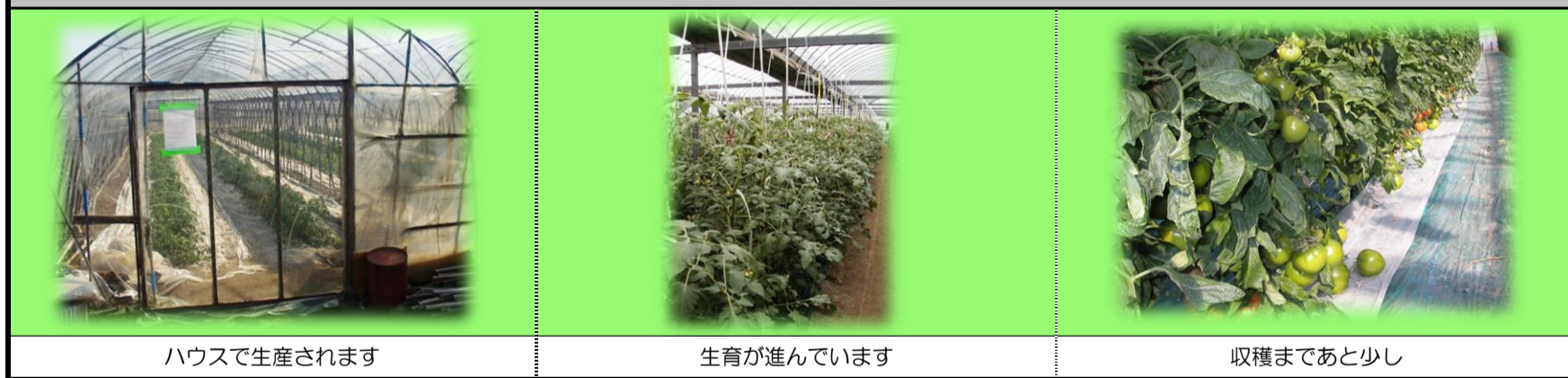
ハウスで生産されます