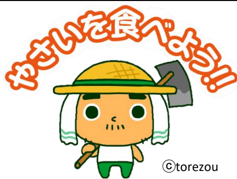
JAいるま野 農産物オリジナルキャラクター「とれ蔵」