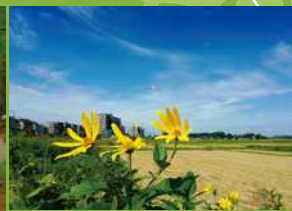
優良賞「秋風にそよぐ」(さいたま市見沼区)