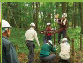
佳作「案内板設置作業」(トラスト9号地)