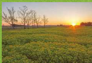
佳作「ノウルシ咲く」(トラスト10号地)