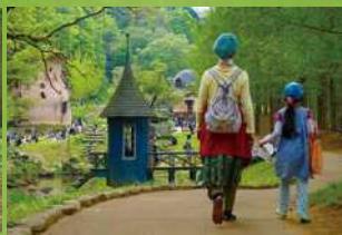
優秀賞「おとぎの国へ」(飯能市)