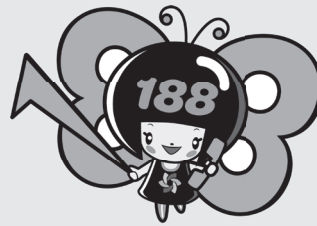
消費者庁 消費者ホットライン188 イメージキャラクター「イヤヤン」

する相談の解決に向け、専門の相談員が助言やあっせん、情報提供をしています。困ったときは一人で悩まず、まずはご相談を！