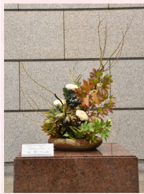
莓、ヒペリカム (紅葉)、ディ スバット(シャ ンパン)、スプ レー菊