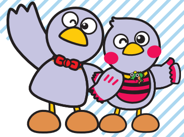
埼玉県マスコット コバトン&さいたまっちゃん