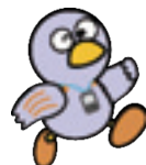
コバトン健康マイレージ