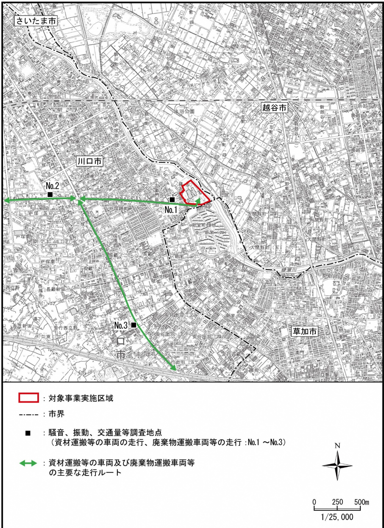
図 12.2-1(3) 事後調査地点図 (騒音、振動)