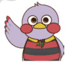
埼玉県マスコット「さいたまちゃん」