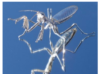
《旅に誘う虫たち オオカマキリ》