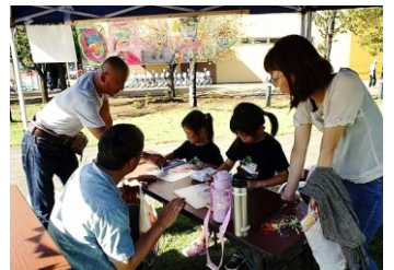
2018.10.06 第3回ハッピーフェスタきたまち 360