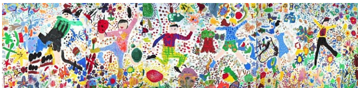
第 50 回 蕨市公募美術展覧会 絵画部門 蕨市美術連盟会長賞