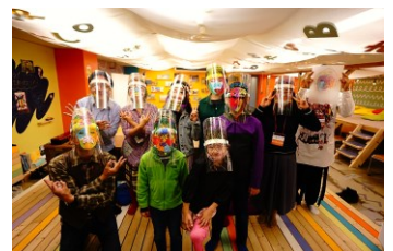
2020.10.31 さいたま国際芸術祭 2020 「お顔をトレース★変身フェイスガードをつくろう！」