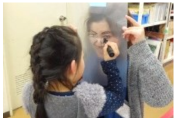
～お顔をトレースしています！～

2020.02.28 さいたま国際芸術祭 2020 Sightama Art Center Project 金曜日の芸術学校