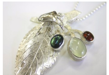
《カメムシとブルーのペンダント》