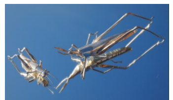
《旅に誘う虫たち イナゴ&ショウリョウバッタ》