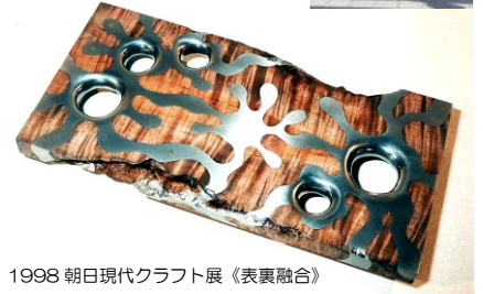
1998 朝日現代クラフト展《表裏融合》