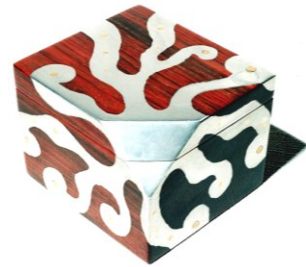
1997 日本クラフト展《融合する箱Ⅱ》