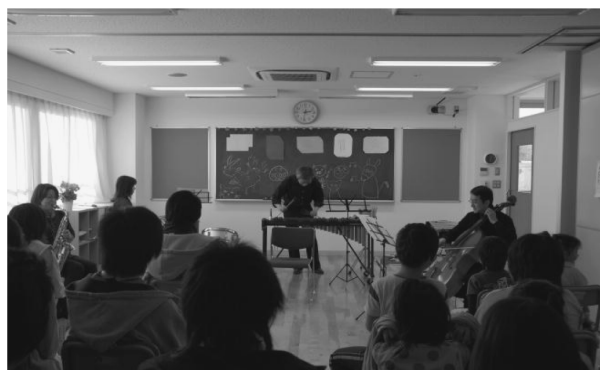
授業の中で芸術鑑賞

嵐山学園は児童や生徒が生活をする場である。学校では見せない表情を多く見せている。そこで、児童や生徒の登校時に「前日帰園後から登校前」までの様子を学園職員から学校側へ伝えてもらう。逆に、児童・生徒下校時には「学校での様子」を学校の側から学園に伝えるよう時間を設定している。それ以外には、月1回のケース会議や、特に情報交換や意見交換が必要な児童生徒については、随時話し合いを持つようにしている。児童・生徒への対応が、学校と学園との間でズレが生じないようにすることが、心のケアにも重要であると考えている。