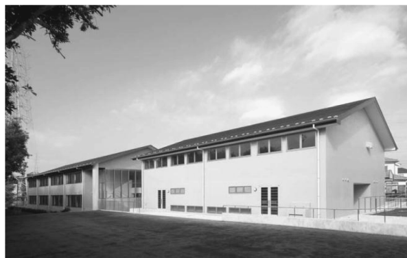
嵐山学園体育館全景