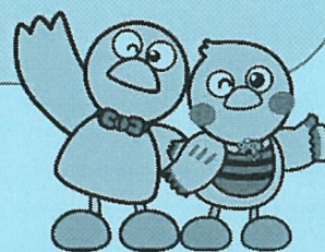
コバトン&さいたまっち