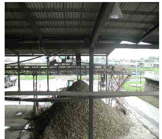
写真はストックヤードに積まれた浄水発生土