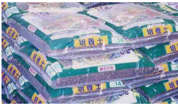
発生土を原料とした培養土

培養土・園芸用土の原料として、また、学校や公共施設のグラウンド用土材料として使用しています。