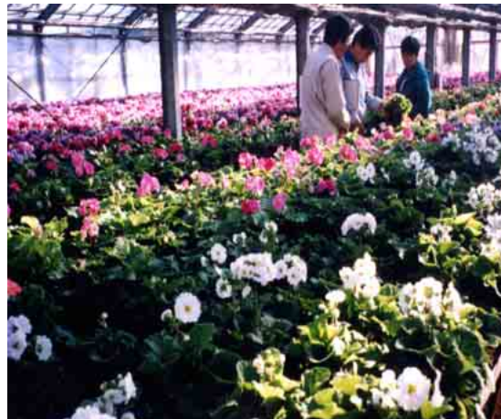
発生土を原料とした園芸用土で育てた花々

培養土・園芸用土の原料として、また、学校や公共施設のグラウンド用土材料として使用しています。