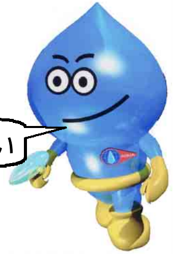
企業局水道部のマスコット・ウォーター太郎