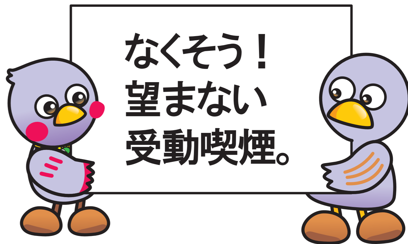
埼玉県マスコット「コバトン」「さいたまっち」

健康増進法が改正され、第二種施設(飲食店、娯楽施設、事業所など多数の者が利用する施設)は、2020年4月1日から原則屋内禁煙となります。このリーフレットでは、健康増進法改正の概要及び第二種施設における法律上の義務についてお知らせします。