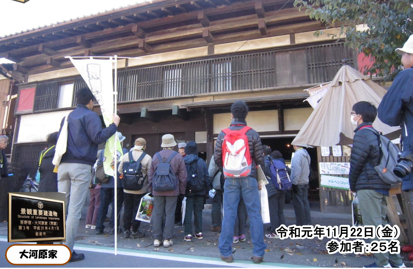
景観重要建造物 Structure of Landscape Importance 吾野宿・大河原家(黒屋) 第3号 平成31年4月1日 飯能市 大河原家