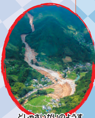
どしゃさいがいのようす

これまでの入賞作品は国土交通省砂防部Webサイトで見ることができます。 https://www.mlit.go.jp/mizukokudo/sabo/kaiga_sakubun.html