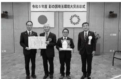
県民部門 大賞受賞