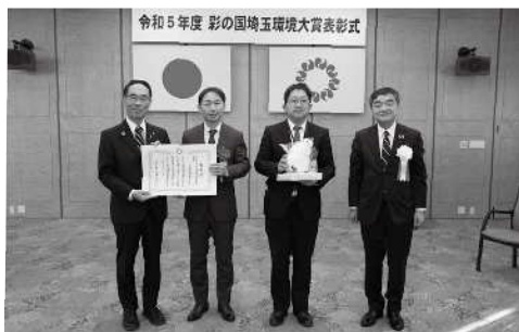
事業者部門 大賞受賞 ヤマキ醸造株式会社