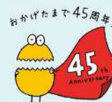
テレビ埼玉マスコット 「テレ玉くん」