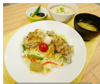
コバトン健康メニュー