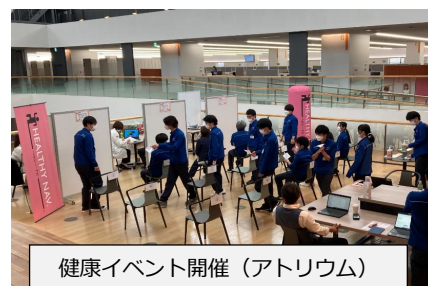
健康イベント開催（アトリウム）

当社は「社会と共に、顧客と共に、従業員と共に、成長する企業」を経営理念に掲げ、従業員の物的、精神的豊かさを追求しています。今後も心と体の健康づくりに取組み、持続的に発展できる企業を目指してまいります。