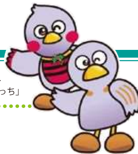
埼玉県マスコット 「コバトン&さいたまっち」