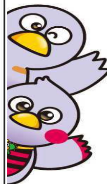
埼玉県のマスコット コバトン&さいたまっち