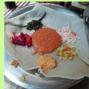
↑バヤアイナットとインジェラ

私の任地ディレダワはソマリ州と接しているので、ソマリ料理の食堂もあります。ピリ辛スパイスの効いたごはんとパスタにフライドポテトがどーんっと盛られてボリュームミー。美味しいですが、ほぼ炭水化物です。笑